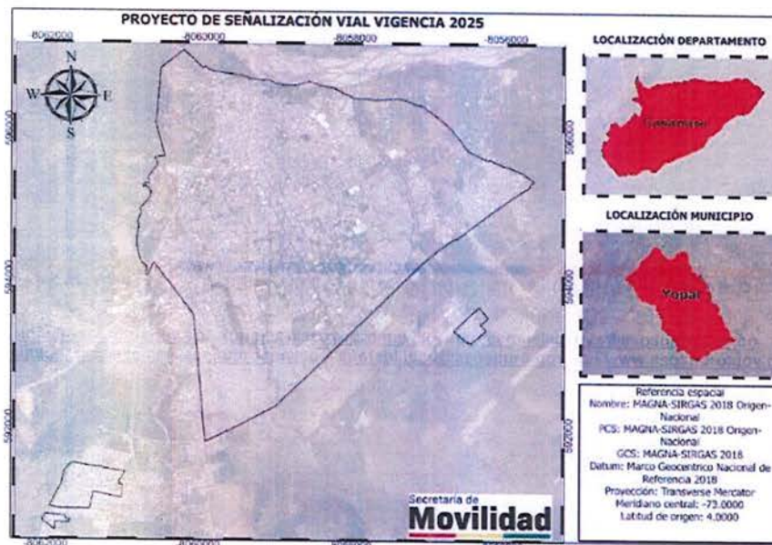
Figura 1.1. Localización